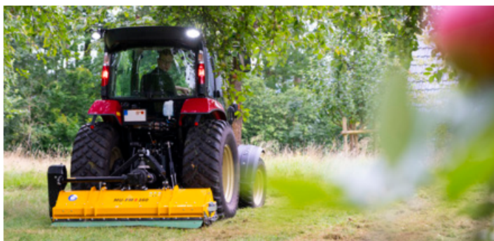
Müthing MU-FM VARIO Front/Heck mit 3-Punktaufnahme Kat. 1