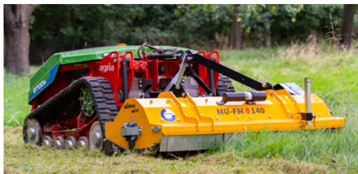
Müthing MU-FM VARIO Front/Heck mit 3-Punktaufnahme Kat. 1