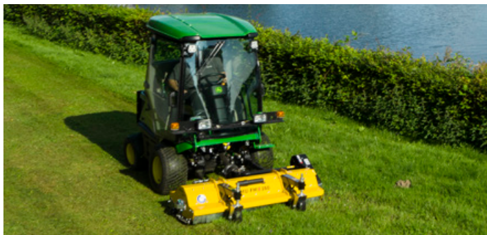
Müthing MU-FM VARIO Front mit 2-Punktaufnahme