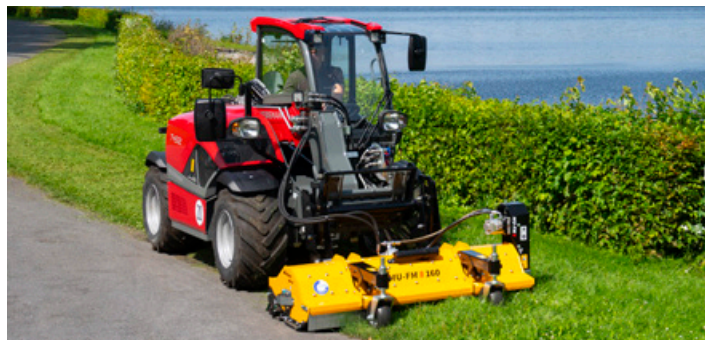
Müthing MU-FM VARIO Hydro