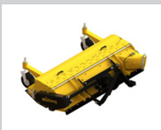
Kat. 0 Kuppeldreieck