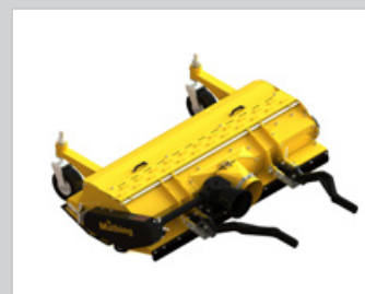
Anbaukonsole für Tragarme