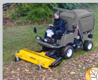
Laub sammeln im Herbst