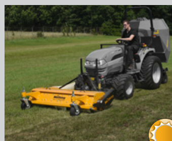
Mulchen im Sommer