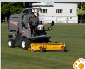
Vertikutieren im Frühjahr