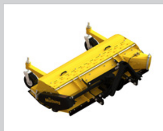
Kat. 1 Kuppeldreieck